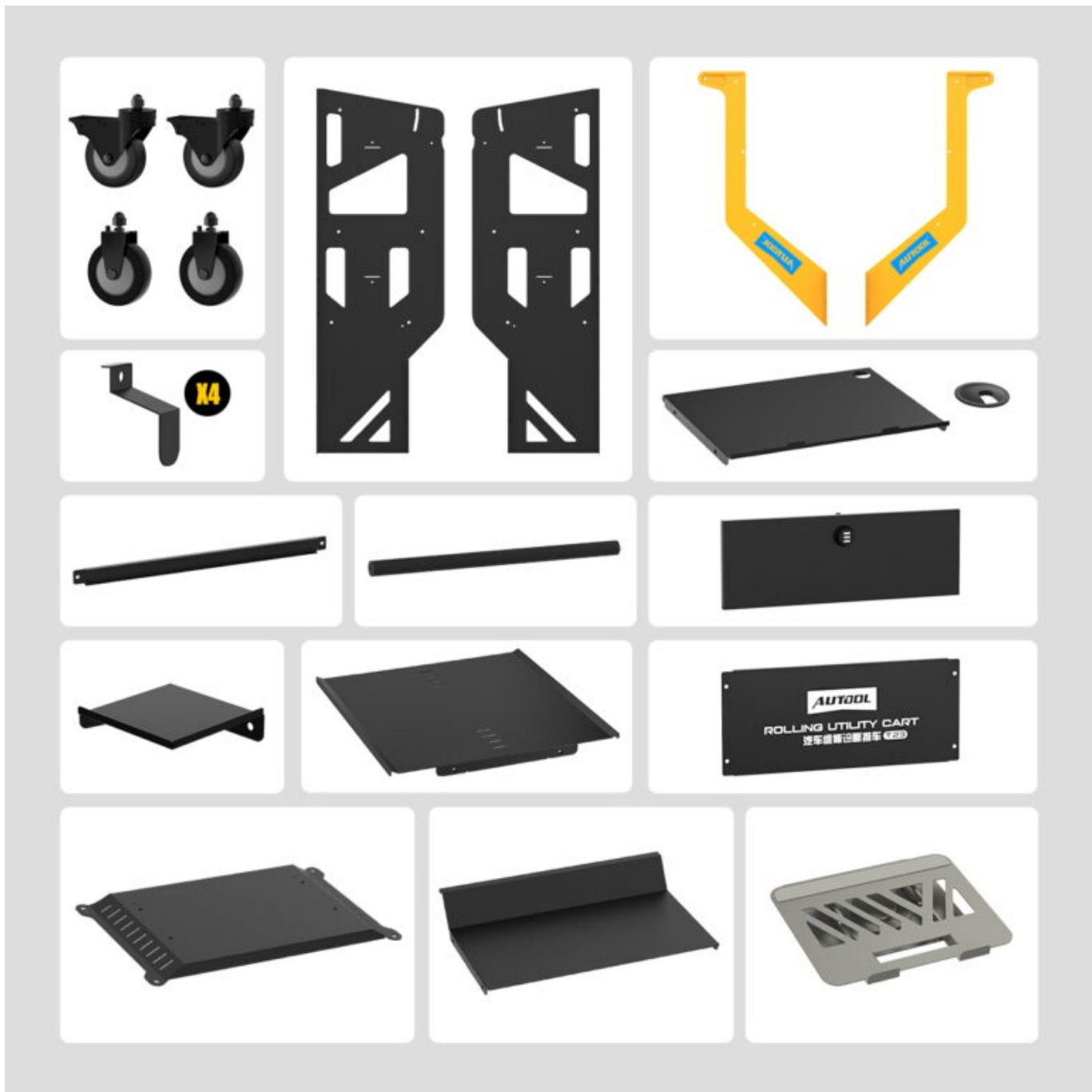
Σκελετός τρόλεϊ T23 | Περιστρεφόμενη βάση 360° | Αθόρυβοι τροχοί 4 ιντσών | Ιμάντας ασφαλείας εξοπλισμού | Πλαϊνά άγκιστρα καλωδίων | Σετ βιδών συναρμολόγησης | Οδηγίες συναρμολόγησης | Συρτάρι με κλειδαριά